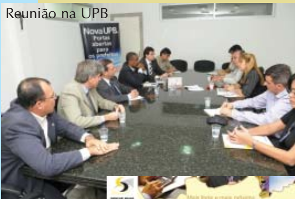
Reunião na UPB