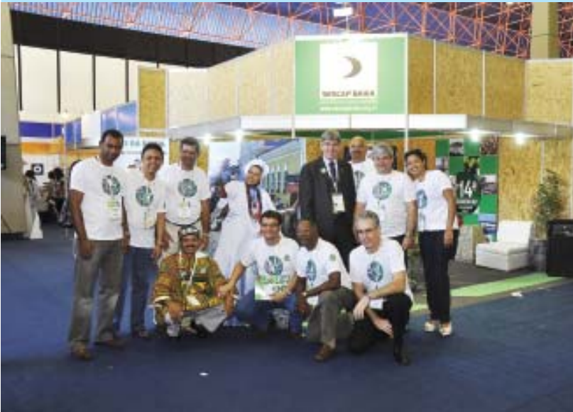
Uma pose da equipe do sindicato para a posteridade