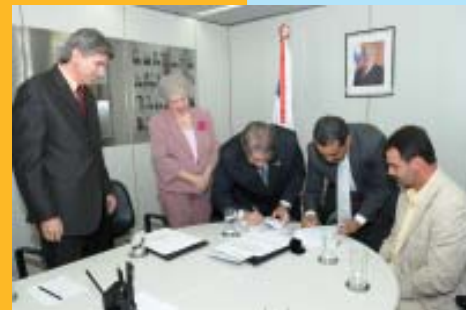
Convênio com a Sefaz

Em paralelo aos eventos, o sindicato fortalece a atuação política, sugerindo leis que desburocratizem a economia e reduzam os impostos. Alinhado à Fenacon, defendeu o Simples Nacional e tem atualmente como um dos eixos de atuação orientar a implementação do Microempreendedor Individual. Celebra convenções de interesse das empresas representadas – como os acordos trabalhistas com o Sindiconta e o Sindipeç, entre outros, definindo melhor a relação direitos e deveres.