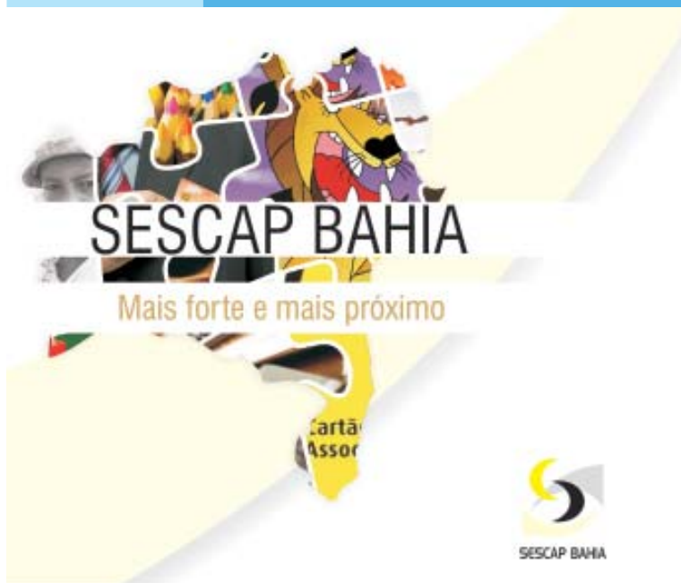
Capa do folder