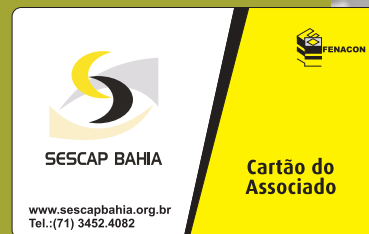
Cartão do Associado

também o Cartão do Associado , com descontos nos estabelecimentos conveniados.