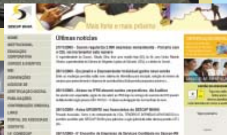
Revista e site (novas mídias)