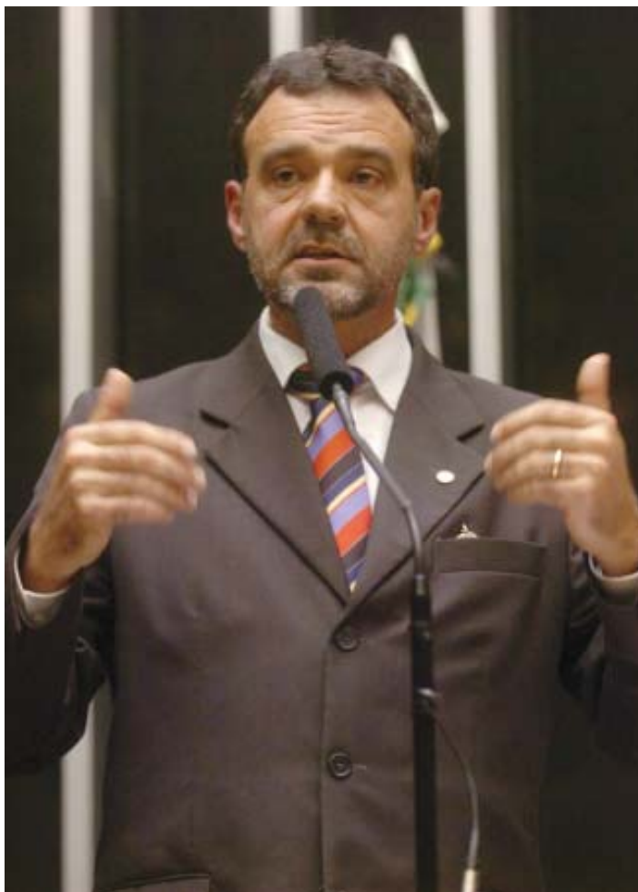
Daniel Almeida, deputado federal do PCdoB

O deputado federal Daniel Almeida, líder da bancada do PCdoB, vem acompanhando o trabalho. Ele avalia que o Sescap BA cumpre muito bem o papel de representar o segmento, unificando posições. "Percebo um avanço na articulação com as estruturas do poder e junto à sociedade. Só tem a progredir", observa.